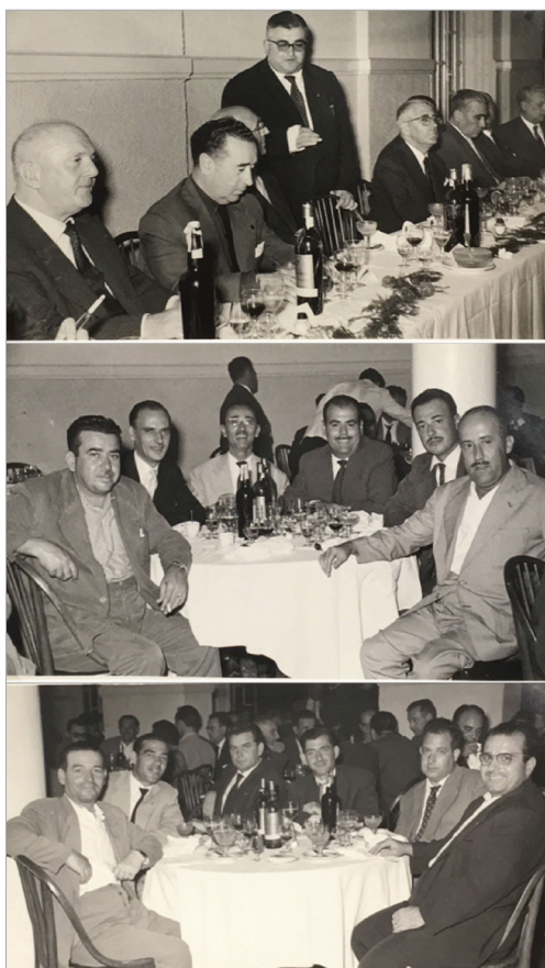
Imágenes 12, 13, 14: Actos de la 1ª Asamblea Departamental: cena en el Hotel Playa (Cádiz).

Acto seguido, se rindió homenaje al almirante Francisco Moreno Fernández (primer marqués de Alborán) ante su tumba en el Panteón de Marinos Ilustres. Después, se celebró misa en la Iglesia del Carmen de San Fernando; y ya finalmente se celebró la asamblea. Esa noche los asistentes a la asamblea pernoctaron el crucero “Canarias”, invitados por el almirante Pascual Cervera, y al día siguiente se produjo en el mismo buque el homenaje de la HMVC al almirante, interviniendo González Caffarena e Ignacio Cañal.