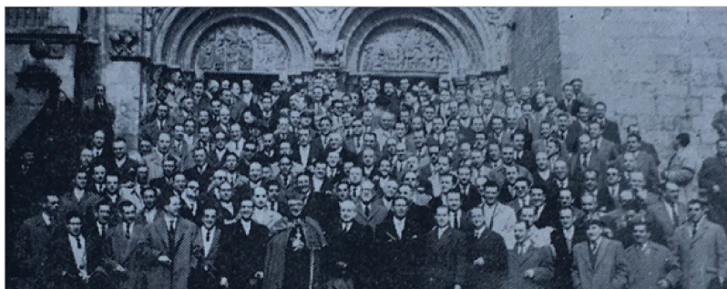
Imagen 1: La primera reunión. Foto de familia de los 230 antiguos marineros voluntarios con el obispo auxiliar de Santiago, después de la misa oficiada en la basílica.

Finalmente, el 23 de febrero tuvo lugar la reunión de 230 antiguos marineros gallegos 53 , fue un éxito y es considerado como el acto que puso en marcha la creación de la hermandad. La reunión consistió en una misa y una comida, el oficio corrió a cargo del obispo auxiliar Novoa Fuentes y al mismo acudió el capitán general del Departamento Marítimo de El Ferrol, almirante Fernández Martín, así como los comandantes de Marina de La Coruña, Vigo, El Ferrol y Villagarcía; el capitán general presidió la posterior comida.