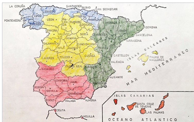
Imagen 2: Organización por Departamentos Marítimos de la HMVC

(ver la figura 2). Por tanto, la HMVC quedó dividida en los Departamentos de El Ferrol, Cádiz, Cartagena-Barcelona y la Jurisdicción Central (artículo 13). Cada departamento sería dirigido por una junta de veinticinco miembros, celebrarían asambleas departamentales anuales, y podrán crear delegaciones en puertos o bases navales. Llama la atención la nula referencia a la creación de “juntas locales” en municipios que no fueran puertos o bases navales.